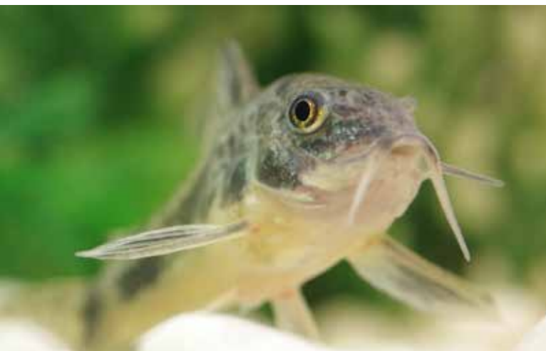
Der Marmorierte Panzerwels zirpt während der Balz, bei Streitereien oder wenn er erschrickt.

Die natürliche Geräuschkulisse von Gewässern variiert beträchtlich, schnell fliessende Bäche sind lauter als stehende Gewässer wie Seen oder Teiche. Natürlicherweise sind Fi-