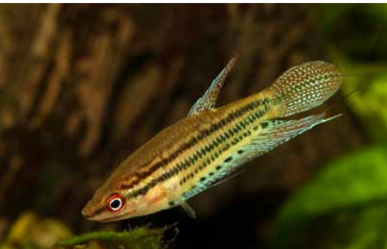
Der Knurrende Gurami zupft wie ein Gitarrenspieler an Sehnen, die an den Brustflossen fixiert sind.