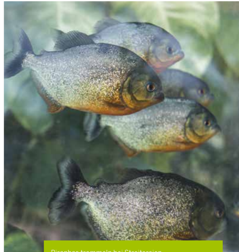
Piranhas trommeln bei Streitereien.