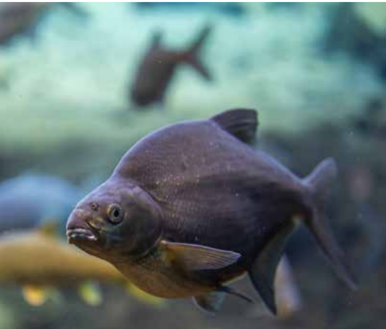
Brachsmen erzeugen mit Hilfe ihrer Schwimmblase Grunzlaute, um mit Artgenossen zu kommunizieren.

Der Knurrende Gurami zupft durch schnelles Schlagen der Brustflossen wie ein Gitarrenspieler an Sehnen, die an den Brustflossen fixiert sind, und Groppen, die keine Schwimmblase haben, vibrieren mit dem ganzen Brustgürtel. Einige Fischarten nutzen wiederum knöchernen Strukturen im Rachen. Beobachtet wurde dies bei Buntbarschen und Anemonenfischen in aggressiven Auseinandersetzungen: Sie reiben dazu ihre Zähne aneinander, was knackende Laute ergibt.